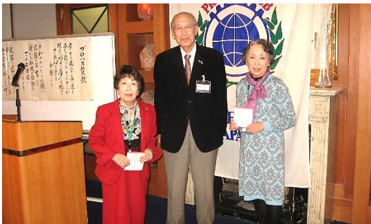
(写真左から、飯田会員、会長、齋藤会員)